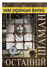
ОСТАННІЙ ШАМАН фентезі-детектив