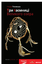
ТРИ ТАЄМНИЦІ ВЕЛИКОГО ОЗЕРА мандрівний детектив