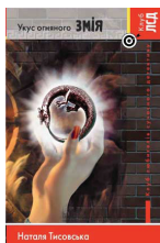
УКУС ОГНЯНОГО ЗМІЯ містичний детектив